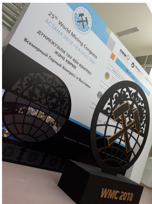
Targi Kazcomak to najważniejsze wydarzenie branży górniczej w regionie

Republika Kazachstanu jest głównym rynkiem eksportowym w regionie Azji Centralnej, zajmującym również ważne miejsce w relacjach z krajami wschodnimi (4. miejsce) oraz polskiej ekspansji eksportowej na rynkach azjatyckich (8. pozycja). Polska jest jednym z głównych partnerów gospodarczych w Europie Środkowo-Wschodniej dla Kazachstanu. Porozumienia osiągnięte podczas wizyt Prezydentów, które związane były z organizowaną wystawą EXPO 2017, pozytywnie wpłynęły na wzrost wymiany handlowej między Polską a Kazachstanem. W porównaniu z 2016 rokiem obroty handlowe wzrosły o 62,6%, w tym eksport z Polski do Kazachstanu o 34%. Dominującą pozycję (15,7%) mają maszyny i urządzenia mechaniczne oraz ich części.