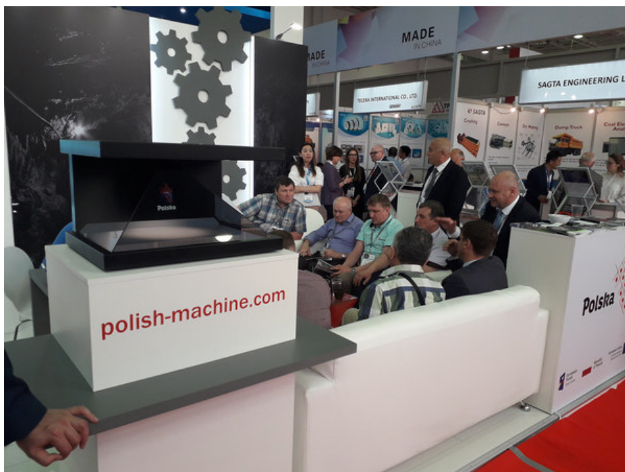
Na polskim stoisku narodowym grupa FAMUR negocjuje kolejne kontrakty.